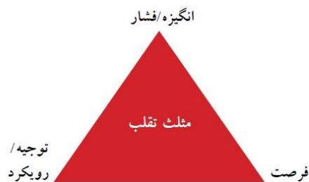
شکل ۱- مثلث تقلب (دورمینی و همکاران، ۲۰۱۲: ۵۵۸)

در این مطالعه، از نظریه مثلث تقلب برای درک تقلب پژوهشی توسط دانشجویان و دانش‌آموختگان استفاده شده است، زیرا ضمن اینکه این نظریه توسط بسیاری از پژوهشگران در رشته حسابداری مورد استفاده قرار گرفته است (چو و تان، ۲۰۰۸؛ الشبیل و همکاران، ۲۰۲۱؛ حجازی و همکاران، ۱۳۹۹)، حرفه حسابداری و حسابرسی، سودمندی مثلث تقلب را در مورد تقلب، به رسمیت شناخته است (محمدی‌مقدم و همکاران، ۱۳۹۷). مثلث تقلب، یک فناوری مدیریت تقلب است که به گونه هم‌زمان ویژگی‌های فردی اخلاقی و شرایط سازمانی را هدف قرار می‌دهد (مورالس و همکاران، ۲۰۱۴). از این رو، نظریه مثلث مورد استفاده قرار گرفته است، زیرا الگوی پذیرفته شده مناسبی برای پیش‌بینی نیت و قصد انجام سرقت ادبی به شمار می‌آید. ایجاد الگوهای تقلب در دهه ۱۹۵۰ از مثلث تقلب شروع شد. چارچوب مثلث تقلب که به صورت رسمی توسط حرفه حسابرسی به عنوان بخشی از بیانیه استانداردهای حسابرسی شماره ۹۹ آمریکا انتخاب شده است، توسط «دونالد کریزی» ایجاد شد. این نظریه بر اساس پژوهش‌های او در مورد جرائم یقه‌سفید و اختلاس توسط افراد مورد اعتماد است (چلیاتسیدو و همکاران، ۲۰۲۳). شکل ۱، اجزای مثلث تقلب را نشان می‌دهد.